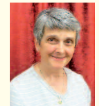
Regie: Anni Utz