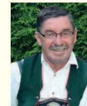
Billeteur: Engelbert Koch